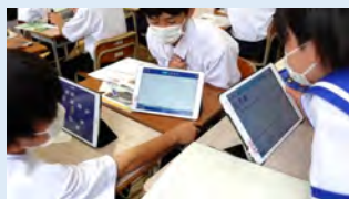
例：「ICTを活用した協働的な学習」

熊本大学教育学研究科では、学校現場のニーズを踏まえた研修用動画の開発を行いました。その成果を報告いたします。