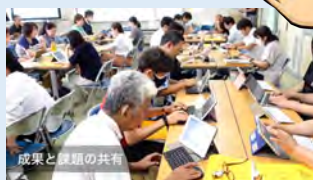
例：「教職員の協働による校内研修」